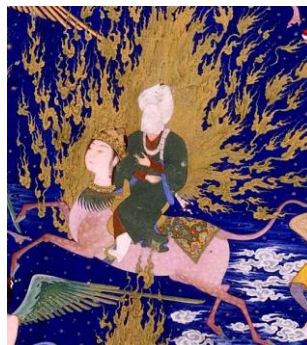
تصویر ۲: پیامبر سوار بر براق.

همان‌طور که در تصویر ۲ دیده شد، رنگ پیراهن پیامبر سبز است. رنگ پیامبر براساس آنچه در مفاهیم عرفانی آمده سبز است و سبز رده مرکز خدایی [۱۱] است. هاله نور و رنگ سبز در بسیاری از نقاشی‌ها نمادی از پیامبر و خود زندگی است (لیمن، ۱۳۹۳: ۵۴) در نگاه کلی جامه پیامبر، پوشش براق و فرشتگان متعلق به دوره صفوی به نظر می‌رسد (ولش، ۱۹۷۲)؛ اما نشانه‌های در پوشش فرشتگان مشاهده می‌شود که مربوط به دوره ایلخانی و تیموریان است. جنسیت فرشتگان با پوشش تاج‌کلاه از هم قابل تفکیک است. کلاه‌ها کروی است شبیه نوعی تاج که در دوره غزنویان و سلجوقیان وجود داشته است و از آن‌جای که لبه‌دار و طلایی است به تاج بیش‌تر شبیه است و به آن‌ها تاج‌کلاه گفته می‌شود. فرشته‌های زن دو گیسوی بافته شده در بالای سر به شیوه تورفان دارند. فرشته‌های زن حجاب ندارند که این از امتیازات زنان مغول بوده است.