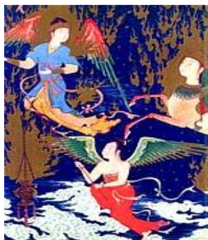
تصویر ۳: فرشته‌ای از نگاره معراج پیامبر منسوب به سلطان محمد

چهره پیامبر، پوشیده شده است. تصویر ۲. این نشان از دو مساله است. یک، سنت اسلامی به مرکزیت بغداد که تصاویر موجودات زنده را به سبب احترام به مقام انسان محکوم می‌کرد، دوم این‌که، چهره پیامبر به دلیل دریافت وحی و نماد تواضع شخصیت وی پوشیده است. پیامبر تنها پیکره دارای ریش در تصویر است. ریش نمادی از ذکاوت و بزرگی برای شخص پیامبر است. به اعتقاد مهدی زاده دست پیامبر(ص) بر روی سینه نشان آرامش درونی است، البته نحوه قرارگیری دست بر روی سینه می‌تواند نشان از ادای سلام و احترام از جانب حضرت محمد(ص) به پیشگاه باری تعالی و جبرئیل باشد که ماموریت همراهی حضرت را دارد. شعله‌های آتش به گرد سر تنها در تصویر دو شخصیت اصلی نگاره دیده می‌شود. شعله‌های آتش به گردش پیامبر با شدت بیش تری نسبت به جبرئیل است که مرتبه اهمیت حضرت را در مقام انسان نسبت به فرشته مقرب نشان می‌دهد [۱۰].